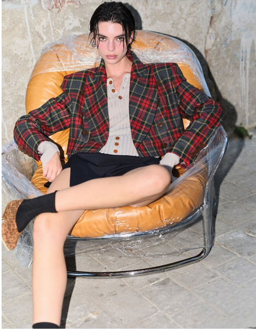
Tüm kıyafetler: Vivienne Westwood/V2K Designers Ayakkabı: Isabel Marant/Beymen Çorap: Penti